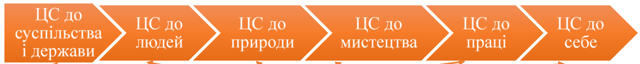
Схема моделі виховної системи Новогуївинського ліцею імені Сергія Процика: «Нова школа: 10 кроків до успіху»

Програма "Основні орієнтири виховних умінь 1-11 класів ЗНЗ"