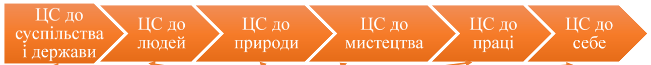
Схема моделі виховної системи Новогуївинського ліцею імені Сергія Процика: «Нова школа: 10 кроків до успіху»

Програма "Основні орієнтири виховних умінь 1-11 класів ЗНЗ"