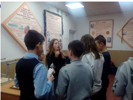
Оформлення учасниками гуртка виставки просвітнього правознавчого змісту до Всесвітнього дня прав людини