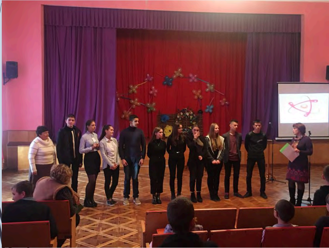
➔ День науки 2019