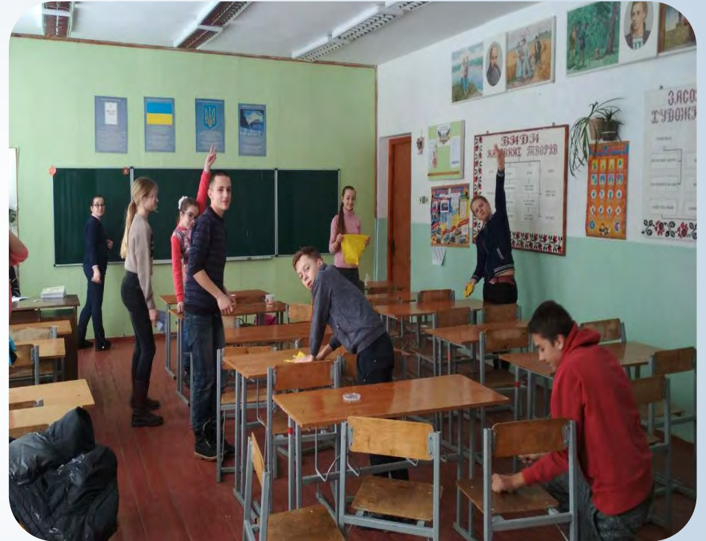
➔ Операція “Чистоклас”