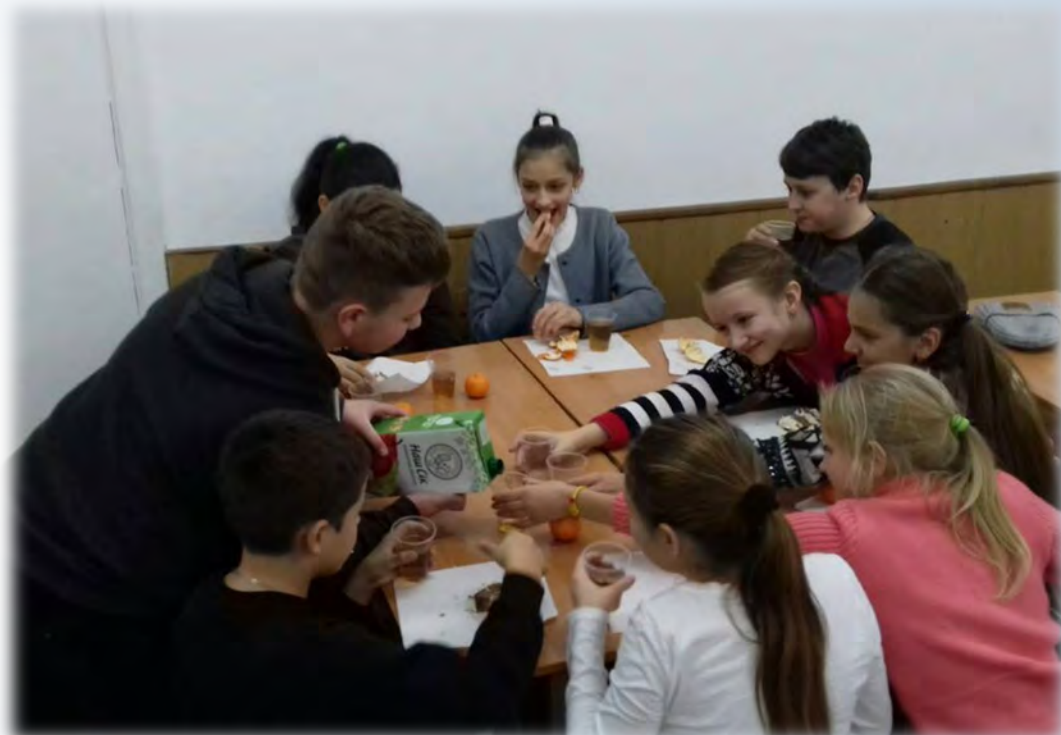
➔ Привітання хлопців зі СВЯТОМ