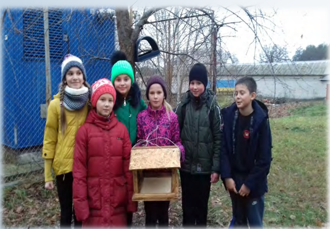
➔ Акція “Годівничка”