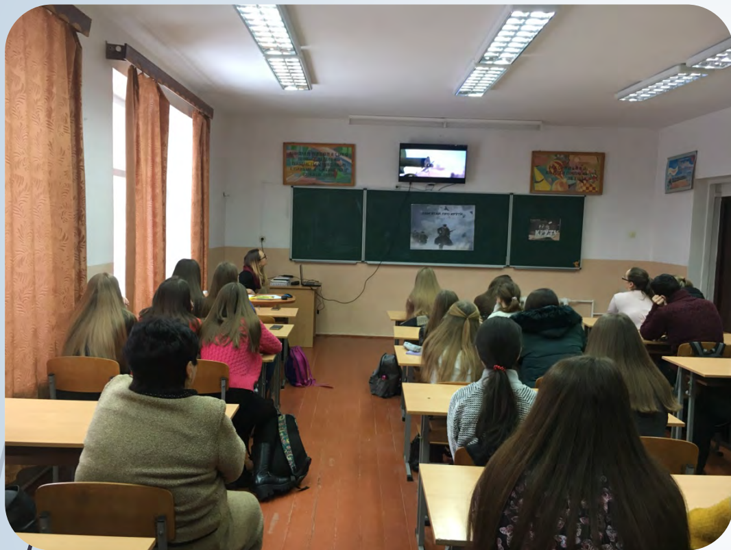
► Урок пам'яті