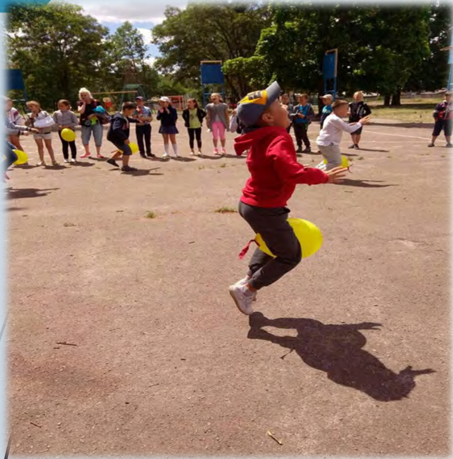
➔ Спортивне свято