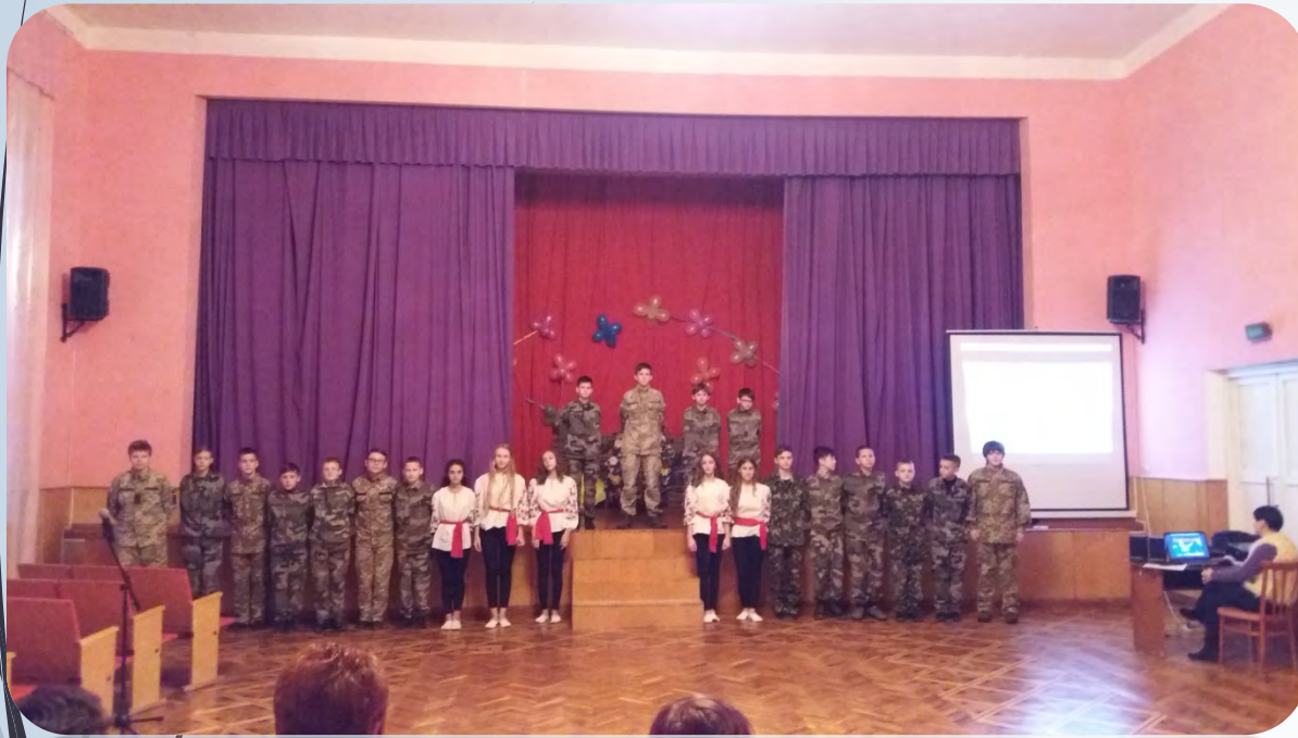
➔ Виховний захід