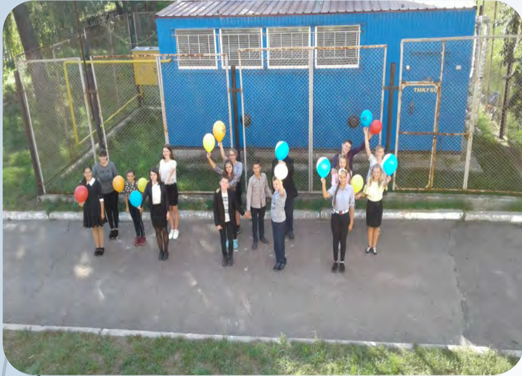
➔ Єдиний урок Миру