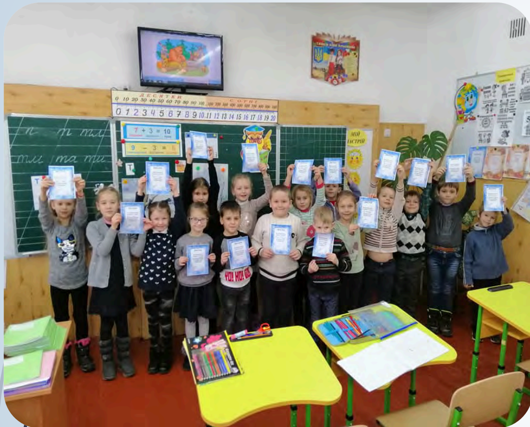
➔ Акція “Годівничка”