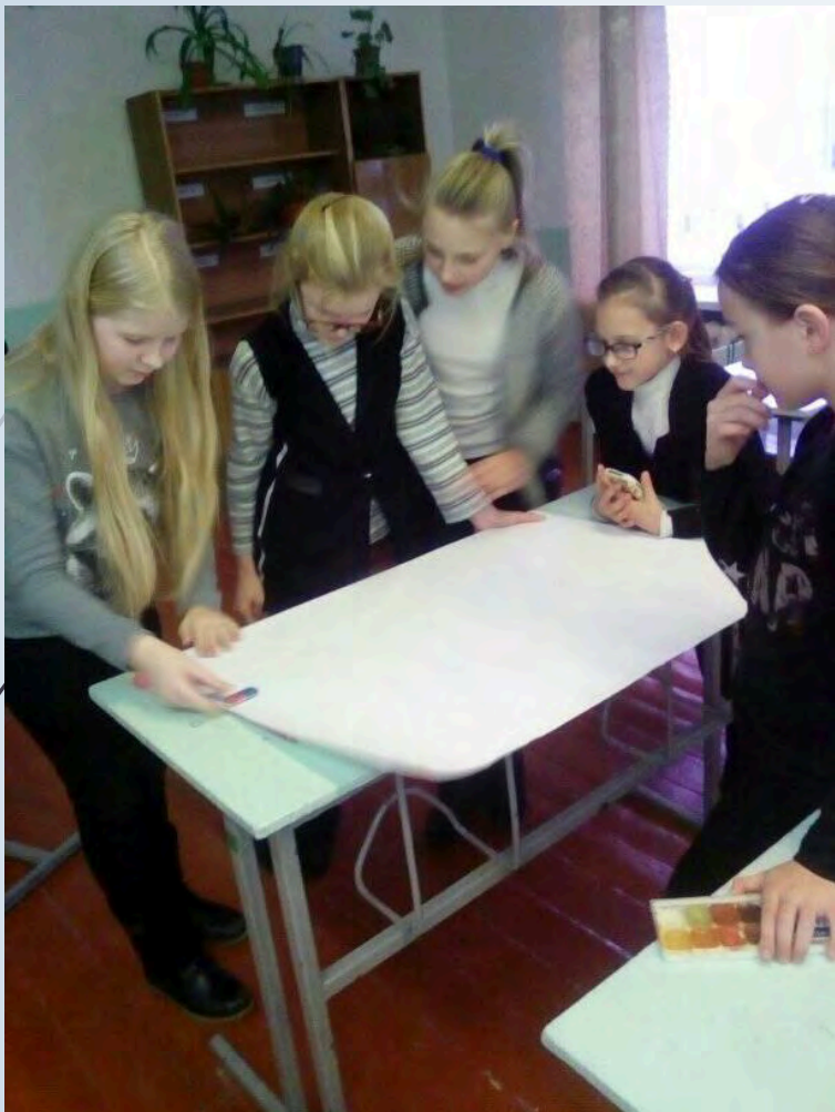
► Виготовлення лепбуку “Я – пасажир”