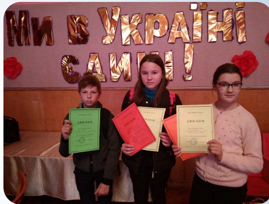
➔ Наші переможці