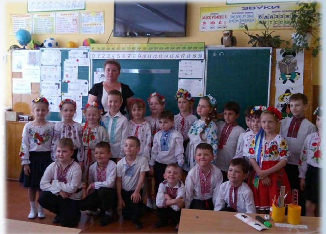
➔ День вишиванки