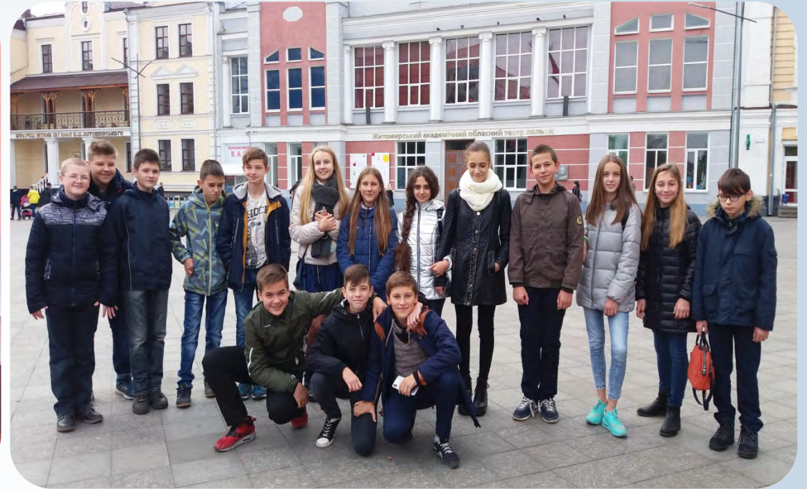
➔ Екскурсія м. Житомир