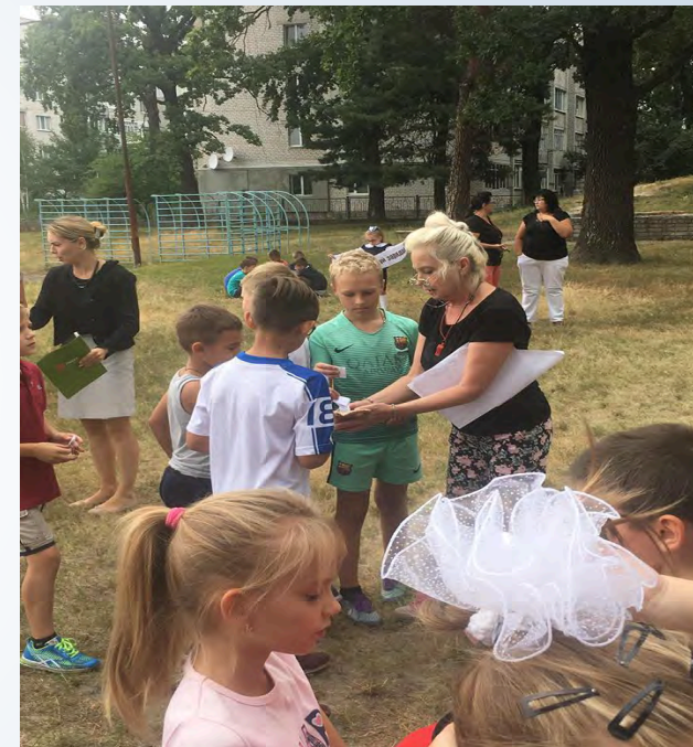
➔ Олімпійський урок