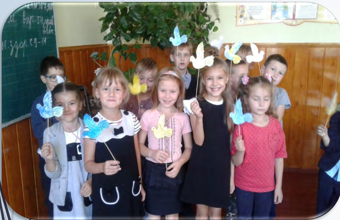
➔ КТС “Голуб Миру”