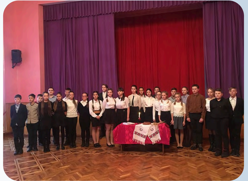
➔ Виховний захід