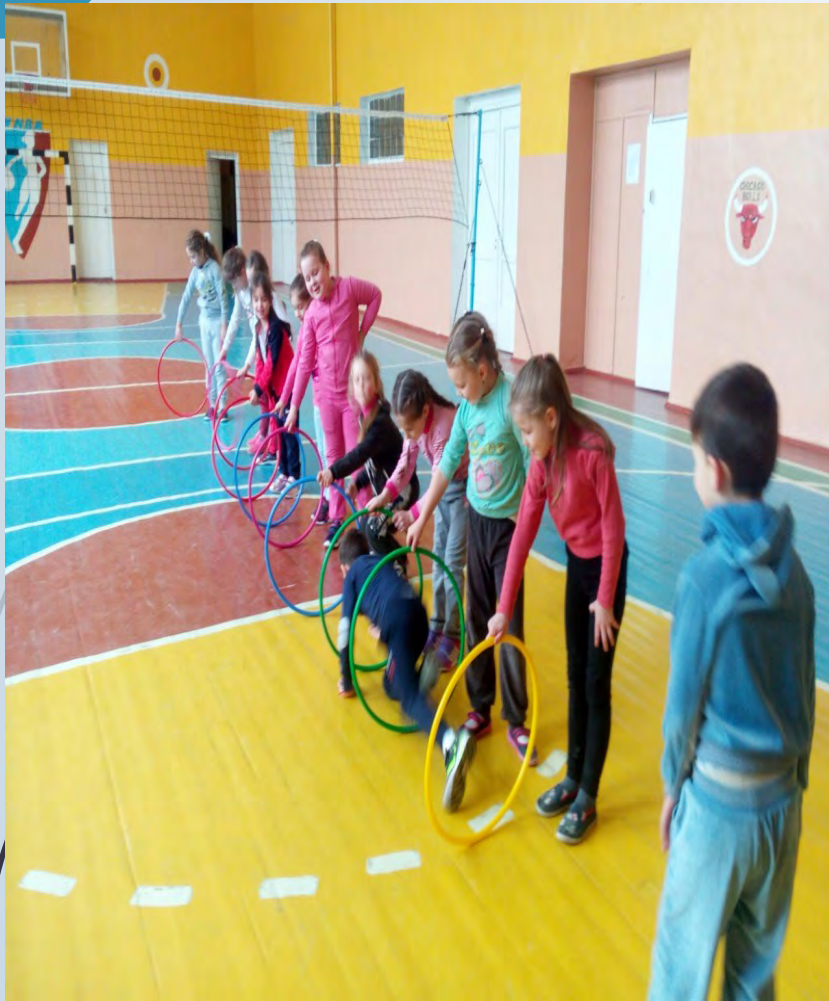
► Уроки фізичного ВИХОВАННЯ