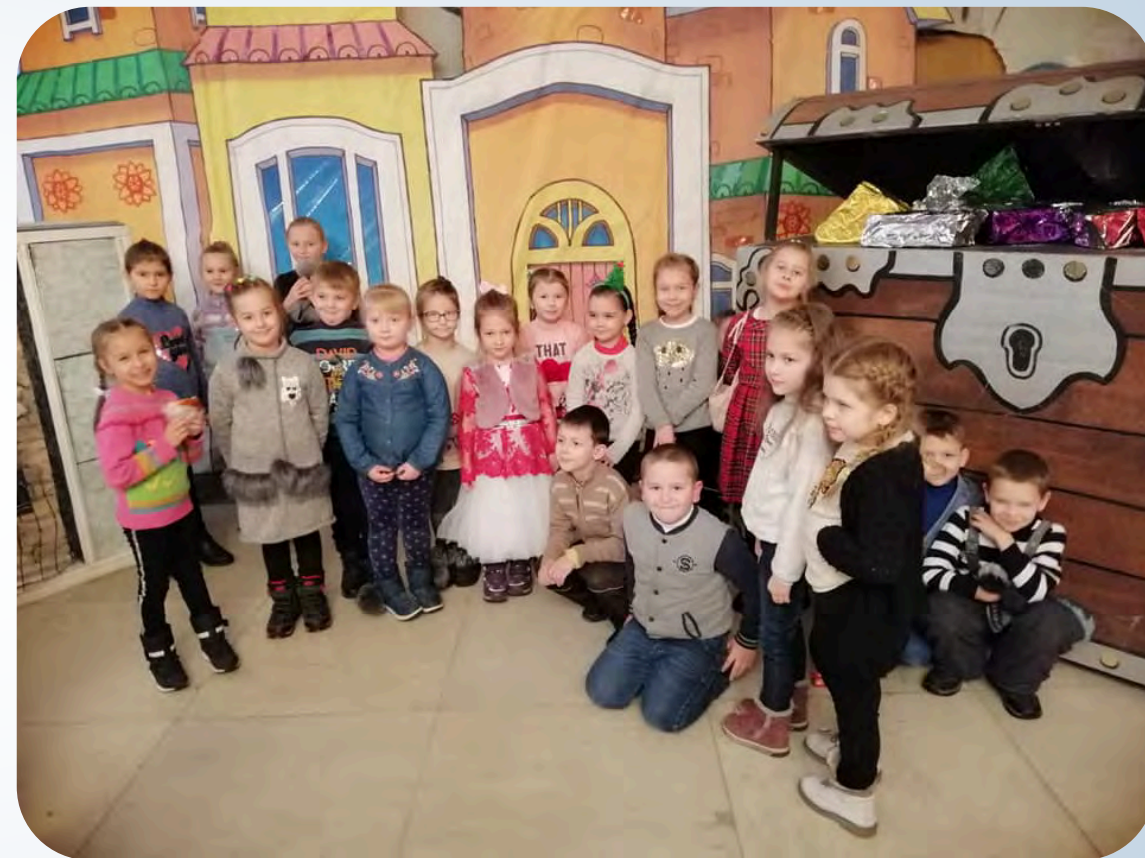
➔ Поїздка у драмтеатр