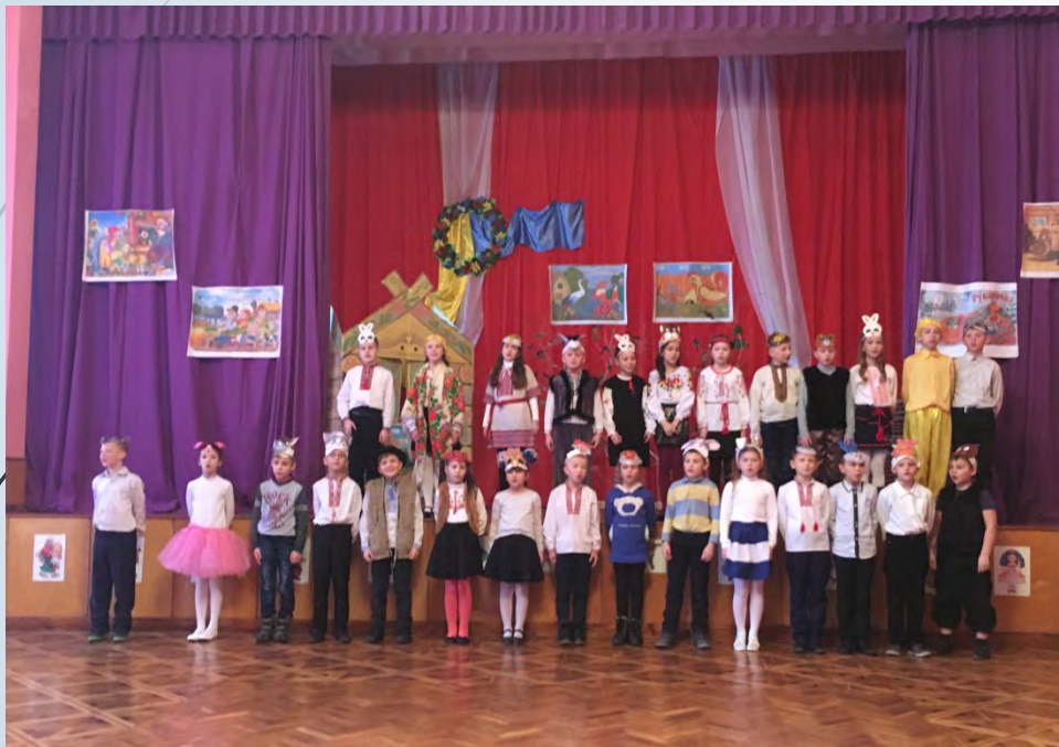
➔ Виховний захід