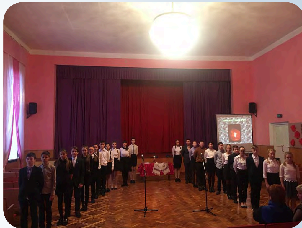
► Мітинг-реквієм “Славні герої Крут”