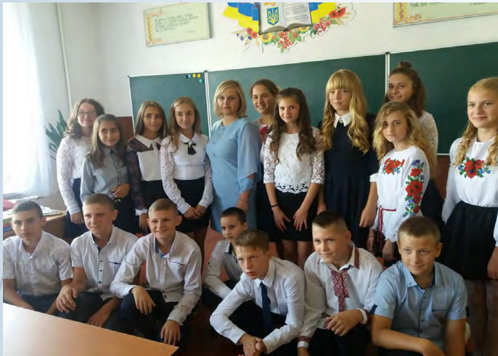
► Перший урок