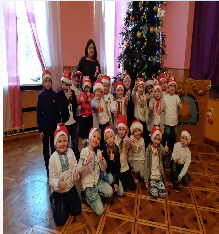
► Новорічні свята