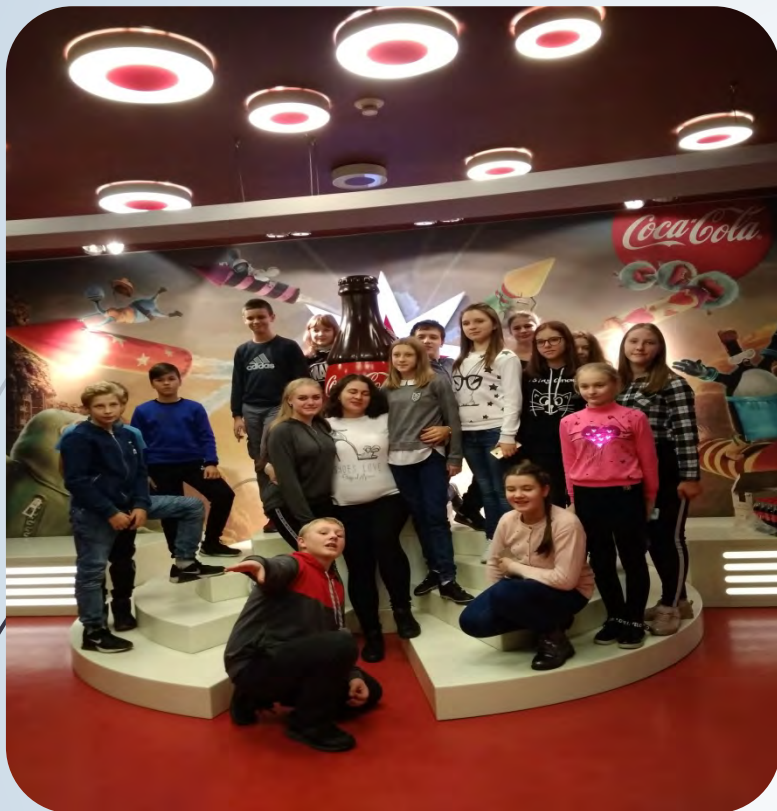
➔ Екскурсія м. Київ