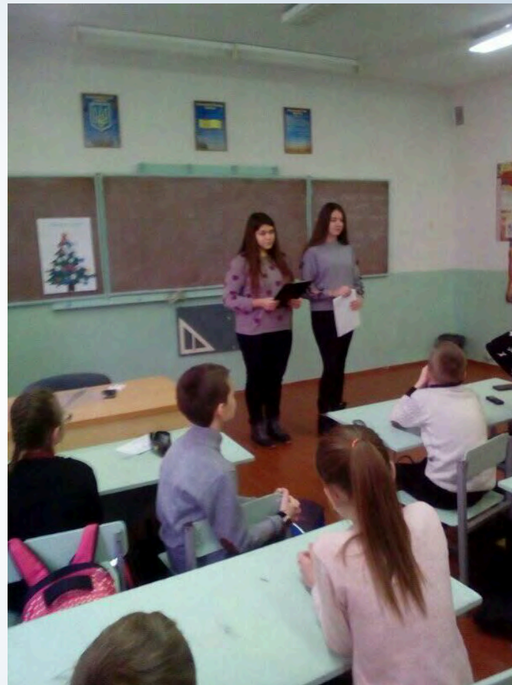
► Правовий лекторій