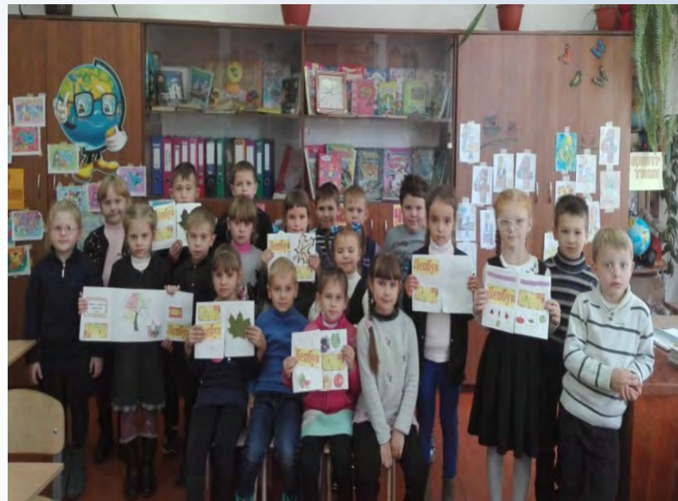
➔ Конкурс лепбуків