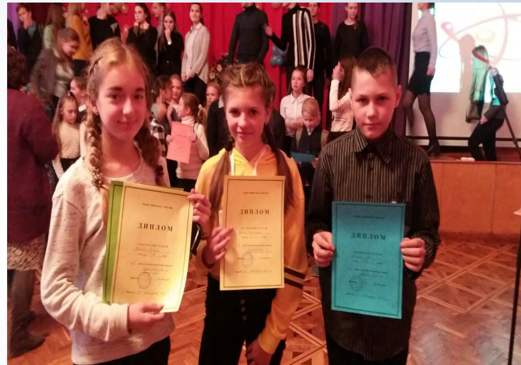
► Наші переможці