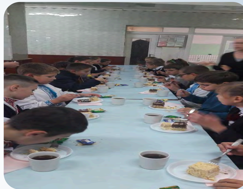
➔ Солодкий стіл