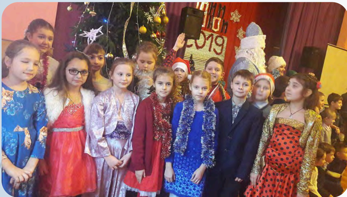
➔ Новорічний вогник