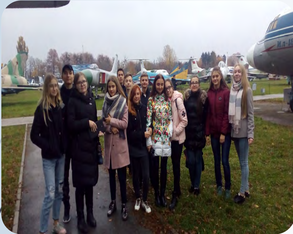
➔ Експурсія м. Київ