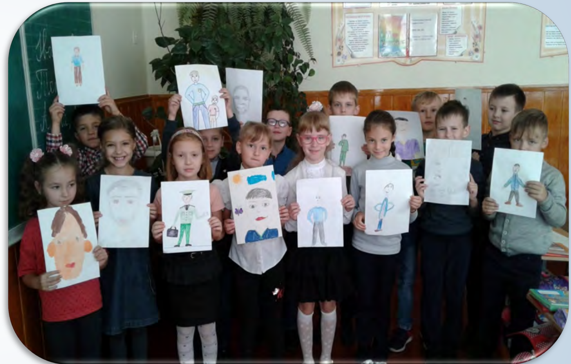
➔ Конкурс малюнків “Мій тато - найкращий”